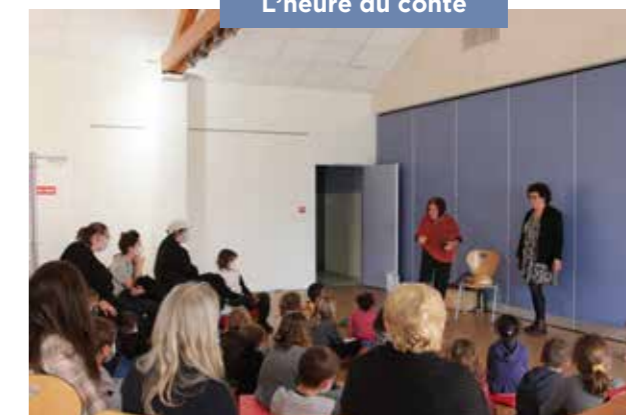
L'heure du conte

Exposition et conférence sur « Le busard Saint Martin dans le Vexin » proposée par le Parc Naturel du Vexin et l'association Ligue de Protection des Oiseaux (LPO) ont rencontré un vif succès auprès des scolaires. En fin de visite les enfants ont répondu à un quizz réalisé par la LPO.