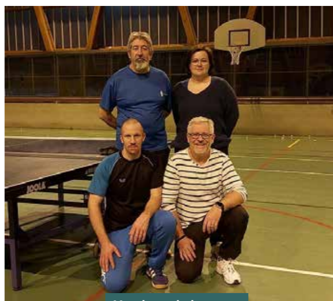
Membres du bureau