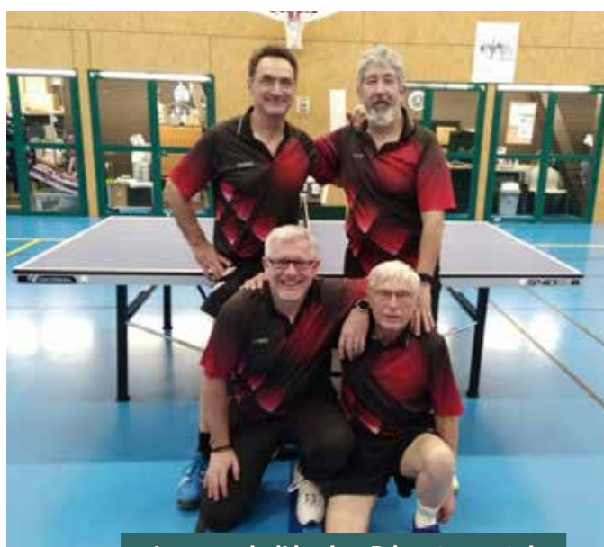
Joueurs de l'équipe Départementale

Pour cette nouvelle saison et pour fêter les 50 ans du club, de beaux projets seront mis en place.